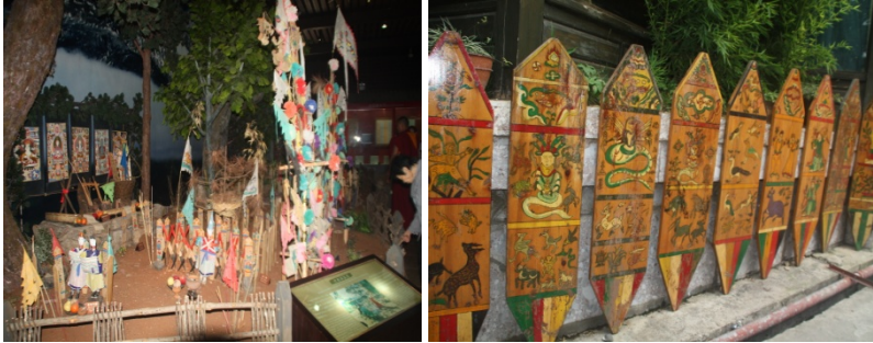
ནམ་མཁའ་དང་རྒྱང་བུའི་སོགས་པའི་མདོས་ཀྱི་བཅའ་གཞི།

ཚོས་ལྷགས་ལ་གཏིང་ཟབ་པའི་རྒྱས་ལོན་མེད་པའི་རྒྱུ་རྒྱས་དེ་ཙམ་འགྲེལ་བཤད་མ་རུས། ཡིན་ནའང་གོང་གི་ ལྷང་གཤེན་ཐེག་པའི་མདོས་ཀྱི་ཡོ་བྱད་ནམ་མཁའ་དང་རྒྱང་བུའི་རིགས་རྣམས་ནི། ད་ལྟ་འཇང་ཡུལ་སྟོན་པའི་ ཚོས་ལྷགས་ཚོ་གའི་མཇེད་སྟོ་འགའ་རེ་སྟེལ་སྐབས་ཀྱི་མིག་ལྡན་མངོན་མཚོན་དུ་གྲུབ་པ་འདིས། བོད་ཡུལ་ བོན་གྱི་རྒྱ་ཐེག་ཚོག་གཞུང་ དག་གིས་འཇང་ཡུལ་སྟོན་ པའི་རིག་གཞུང་ལ་ལྷགས་ རྒྱུན་བཟོས་འདུག་པའི་ གསལ་བྱེད་དང་དངོས་ དཔང་བཞུན་ཡོད་དོ།