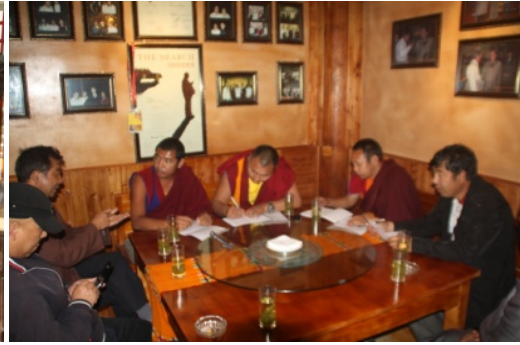
འཇང་གི་སྟོན་པའི་ཚོས་ལུགས་ཆེད་མཁས་པ་རྣམས་དང་མཉམ་དུ་བཤོ་གྲོང་གྲོས་མོལ།