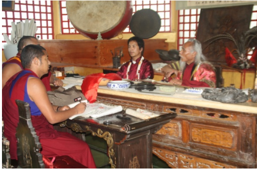
ལེས་ཅང་འཇང་རིགས་སྟོན་པ་རྣམས་དང་ལྷན་དུ་བྲི་བ་བྲིས་ལན།