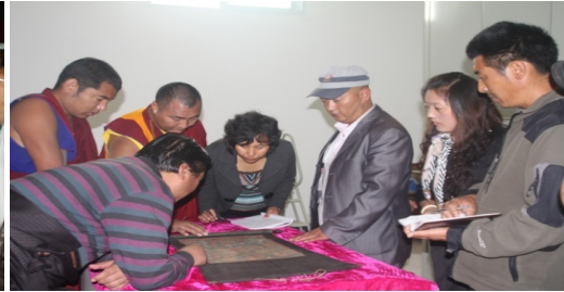
བདེ་ཆེན་ལུལ་གནའ་ཇེས་རིག་གནས་འགྲེམ་སྟོན་ཁང་།