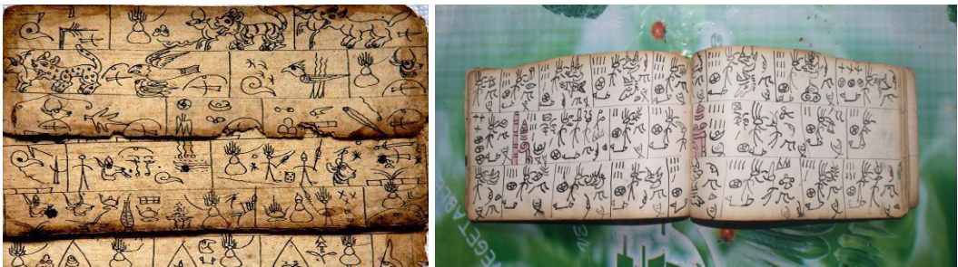
འཛུགས་ཀྱི་སློབ་པའི་ཚོས་ལུགས་ནང་དུ་བཀོལ་བའི་འདྲ་གཟུགས་དེའི་རྟིང་།

ཡོན་ལ་སློབ་སྦྱོང་བྱས་རྗེས། ཕྱིར་རང་ཡུལ་དུ་ལོག་ནས་ཚུ་དཀར་ནག་ས་ཁུལ་གྱི་“གཤེན་རབ་སྐབ་ཕུག” (什罗灵洞) ལ་བཞུགས་ཤིང་སློབ་སྦྱོང་ 11 མཇུག་པ་དང་བོད་བརྒྱུད་བོན་གྱི་ཚོས་ལུགས་འཛུགས་ཀྱི་ཡུལ་དུ་དར་སྐོས་བྱས་པ་ཡིན། གཞན་ཡང་། ལྷོན་པའི་རིག་གནས་ཞིབ་འཇུག་པ་སྐྱེ་ཞབས་ལེས་ཀང་མཚོག་གིས་བཤད་ན། རྒྱ་ནག་གི་ཆེན་རྒྱལ་རབས (清代) སྐབས་སུ་ཡང་འཛུགས་ཀྱི་སློབ་པ་འགའ་ཤེས་བོད་ཡུལ་དུ་ཕེབས་ནས་སློབ་སྦྱོང་བྱས་པ་ཡོད་ཅེས་གསུངས། ད་དུང་འཛུགས་ཀྱི་འདྲ་གཟུགས་ཡི་གེ 12 གསར་གཏོང་བྱེད་པོ་ལ་ལྷ་ཚུལ་མི་འདྲ་བ་གཉེས་སུ་ཡོད་པ་ལས། འཛུགས་ལྷོ་ཤེ་ཤེ་ཡིས་སློབ་པ་གཤེན་རབ་ཁོང་གིས་གསར་གཏོང་གནང་བའི་འདྲ་གཟུགས་ཡི་གེ་ལ་