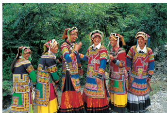
འཇང་རིགས་བུ་མོའི་ཆ་ལྷགས།

འཇང་རིགས་བྱུང་མེད་རྣམས་ཀྱིས་དུས་ཆེན་སྐབས་སུ་པན་ཚུན་ལག་པ་སླེལ་ནས་གྲལ་བསྐྱོགས་ཏེ་གཡམས་ སྐོར་བྱེད་ཚུལ་གྱིས། འཇང་ཡུལ་སྟོན་པའི་ཚོས་ལྷགས་རིག་གཞུང་དང་འབྲེལ་བ་ཡོད་པ་ལྷ་བུའི་བློ་གར་འབྲལ་བ་ གྱུན་འདུག་ལ། གར་མཐན་མི་མོ་དག་གིས་གཟབ་སྐྱོས་བྱེད་པའི་ཆ་ལྷགས་ལ་སྦྱར་བཏང་ཡུལ་ལྷང་རང་གི་ཁྱད་ བོན་ཅུང་ཅམ་ལྡན་པ་ལས། ཚུ་བའི་ཆ་ནས་འང་ཁྱུང་དང་རྒྱལ་རོང་བུ་མོའི་རྒྱན་གོས་དང་འབྲེལ་བ་དམ་ཞིང་ འདྲ་མཚུངས་ཆེ་བ་མ་ཟད། ཁོང་ཚོས་གར་ཚེད་དེའི་མིང་ལ་ཤོ་ལུས་ཞེས་འབོད་པ་དང་འང་ཁྱུང་ཡུལ་སྟོན་གར་ ཚེད་ཞིག་ལ་མངའ་རི་བ་རྣམས་ཀྱིས་ཤོན་ཚེད་བཟུང་བས། ཐ་སྙད་དེ་རིགས་ཀྱི་མཚན་དངོས་ཐོག་མ་ཤོ་དང་ཤོན་ གཉིས་སྐྱ་བྱུང་ཕྱོགས་མཐུན་གྱུར་བ་ལའང་བསམ་གཞིགས་བྱེད་དུ་ཡོད་པར་སེམས།།