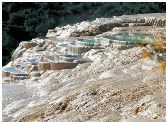
རྒྱ་དཀར་ནག་ས་ཁུལ་གྱི་ཁོར་ཡུག