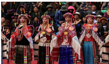
རྒྱལ་རོང་བུ་མོའི་ཆ་ལྷགས།