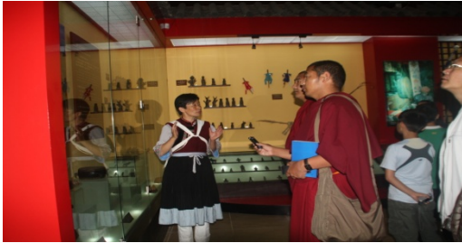
ལེས་ཅང་སྟོན་པའི་རིག་གནས་འགྲེམ་སྟོན་ཁང་།