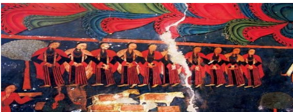
གུ་གའི་ལྷ་ཁང་གི་གྲང་རིས་རྗེད་པའི་དོས་ཀྱི་མངའ་རིས་བུ་མོའི་རྒྱན་གོས།