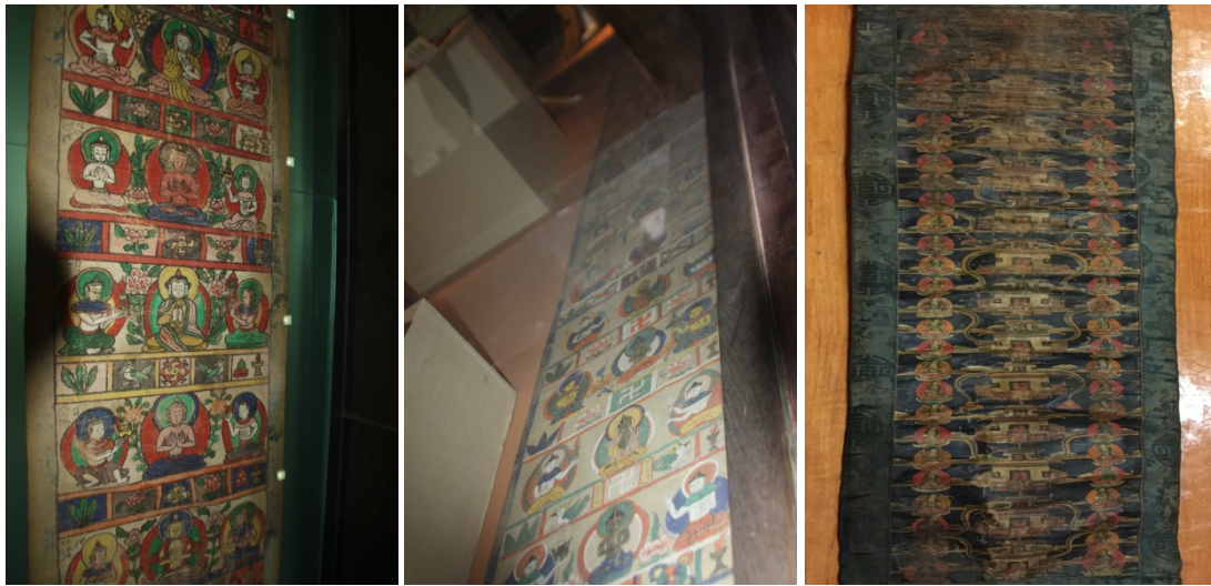
ཡིས་ཅང་སྟོན་པའི་རིག་གནས་འགྲེམ་སྟོན་ཁང་དུ་བཞུགས་ བདེ་ཚེན་ཁྱུ་གནའ་རྩལ་རིག་གནས་འགྲེམ་ཁང་དུ་བཞུགས་ གཞུང་དུ་བོན་ལྷགས་ཀྱི་ས་བཅུ་གནམ་གནམ་ཟམ་ཐང་རིས། པའི་ས་བཅུ་གནམ་ཟམ་དང་འདྲ་བའི་གཞུགས་རིས། པའི་ས་བཅུ་གནམ་ཟམ་དང་འདྲ་བའི་གཞུགས་རིས། ད་ལྟ་མདོ་སྐད་སྐད་ཞིག་དགོན་རྒྱུ་འོབས་སྐང་ཐང་དུ་བཞུགས།

གཞུང་ནང་དུ་ཡོད་པའི་“གཤེན་རབ་ཀྱི་འཕོ་བའི་ཚོ་ག” 21 ཞེས་པ་དེ་ཉིད་སྐད་ཡིག་གཞུང་དུ་སྤྱར་མོ། རྒྱ་ཆ་ནས་ ཞིབ་མཐོང་ཚོགས་ནས་ཇི་ལྟར་འཕོ་འགྱུར་སོང་འདུག་པ་གསལ་བོར་བཤད་ཐུབ་པར་དཀའ་ནའང་། སྤྱི་ཚུན་ནས་ སངས་རྒྱལ་གཞུང་དུ་བོན་གྱི་དཔེ་གཞུང་ལས་གཤེན་པོའི་རྣམ་ཤེས་སྤར་ཐབས་བསྟན་པའི་བྱང་ཚོག་དང་དབྱེ་ བ་མེད་པར་མཚོན་ལུས།