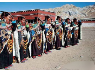
སྟོན་མངའ་རིས་བུ་མོའི་ཆ་ལྷགས།