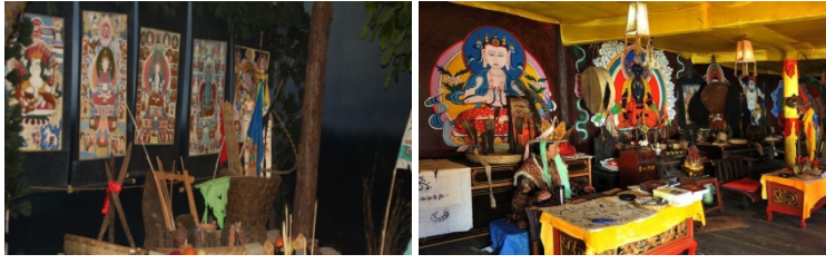
འཇང་རིགས་སྟོན་པའི་ཚོས་ལྷགས་ནང་གི་རྫོགས་སྐྱའི་ཆ་ལྷགས་ཅན་གྱི་སྐྱབས་བརྟན་ལྷ་རིས།

22 སོགས་ནས་བསྟན་པའི་ཡི་ ཤེས་ལྷ་ལས་རྒྱལ་བ་སྐྱེ་ལྗེ་ ལྷ་ལྷ་བཞེངས་པའི་རིགས་