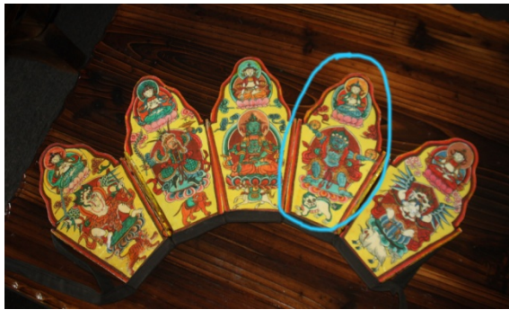
ཡི་དམ་གྱི་སྐུ་པར་འདི་ནི་ད་ལྟ་ཡུན་ནན་བདེ་ཆེན་ལྷུ་འཁོར་ལྷུ་བཞུགས་པའི་ཚེ་དེ་དང་འཇང་རིགས་སྟོན་པ་ རྣམས་ཀྱི་དབུ་ལ་གསོལ་བའི་རིགས་ལྔ་ངོས་ཀྱི་ཡི་དམ་ཁྲོ་བོའི་སྐུ་བརྟན་གྱི་འབྲིང་སྟབས་དང་གཡམས་གཡོན་ཕྱག་གཉིས་ན་འཁོར་ལོ་བརྒྱུམས་ པ་དང་ཡོངས་སུ་མཐུན་པས་གཅིག་ཏུ་འདོད་པར་སེམས།