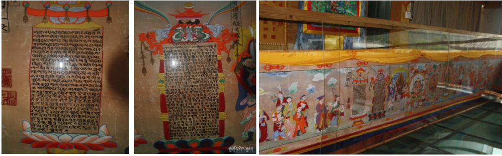
ཡིས་ཅང་ཇ་ཚོང་རིག་གནས་འགྲེམ་སྟོན་ཁང་གི་བོན་དཔེ་ཡིག་གསུགས་ཁྱད་མཚར་ཅན།

པའི་ལྷ་ཚུལ་བཏོན་ཡོད་པས། ཞིབ་འཇུག་པ་དང་བོན་པོ་ཀུན་གྱིས་མ་ཡིག་དངོས་དཔེ་འཚལ་ཏེ་རྗེད་སོན་གྱི་ ན་རིན་ཐང་ཆེ་བ་ཞིག་ཏུ་སྒྲུང་རོ།།