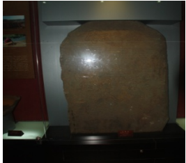
ལིས་ཅང་བོད་བཅོན་པོའི་རྩི་རིང་།

སྤྱིར་བོད་དང་བོན་གྱི་ལོ་རྒྱུས་ཡིག་ཚང་ཁག་ལས་འཇང་དང་བོད་ཀྱི་འབྲེལ་བ་བཞུན་པའི་ཡིག་ཆ་མང་དུ་ བཏོག་ཀྱང་། འདྲིར་འཇང་ཡུལ་ལས་ཐོན་པའི་དབྱུང་གཞི་འགའ་ཞིག་གཙོ་བོར་བརྒྱུད་ནས་བོད་འཇང་འབྲེལ་ བ་ཕྱན་ཙམ་སྐྱེད་བའི་ནི། རིག་གནས་གསར་བརྗེ་སྐབས་ལ་འཇང་རིགས་ལིས་ཅང་མང་ཚོགས་ཀྱིས་རྒྱངས་འཁོར་ བཏོད་ལམ་བཟོ་བཞུན་བྱེད་སྐབས། བཅོན་པོའི་དུས་སུ་བསྐྱེད་པའི་རྩི་རིང་ ཞིག་རྟེན་འདུག་པ་ནི། ད་ལྟ་ཡུན་ནན་ཞིང་ཆེན་ལིས་ཅང་རིག་གནས་འགྲེམ་ སྟོན་ཁང་དུ་བཞུགས་ཡོད་ལ། དེའི་དོས་སུ་ “བཅོན་པོ་སྣ་གྲས་ལ་སྟོ་བ་ཉེ་སྟེ་སྟོན་ རྒྱུས་བཟང་ལ་ཕྱག་འཚལ་ནས་” ཞེས་སོགས་བོད་ཡིག་དབྱེ་ཅན་ལམ་ནས་བྲིས་