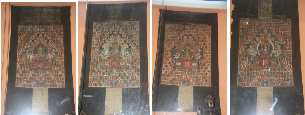
ཡུན་ནན་བདེ་ཆེན་ལྷུ་འཁོར་ལྷུ་བཞུགས་པའི་བོན་གྱི་ཐང་ག་དཔེ་གཤེགས་གཙོ་བོའི་ཐང་ག་