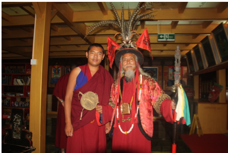
རྒྱ་གོང་དགོ་བཤེས་ཤེས་རབ་རྒྱ་མཚོས་སྤྱི་ལོ་༢༠༡༤ལོའི་ཟླ༡༢ཚེས་༡༧ཉིན་མཇུག་རྫོགས་པར་བྲིས་པའོ།