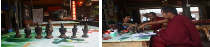
འཇང་པའི་གཏོར་མ་བཅའ་ལུགས།

སྟོན་པ་རྣམས་ཀྱིས་ཚོས་ལུགས་བྱེད་སློབ་སྦྱོར་སྐབས་དབུ་ལ་བསྐྱམས་པའི་རིགས་མའི་ངོས་སུ། བོན་གཞུང་《ཕྱི་ནང་གསང་གསུམ》ལས་བཟུན་པའི་“སྟོན་པ་གཤེན་རབ” (东巴什罗) དང་། 《སྤྱི་གི་དཀར་པོ་ལྷ་བ་གསང་རྫོང་》 14 ལས་བཟུན་པའི་“སྤྱི་ལ་མེ་འབར” (达拉美布) དང་། 《སྤྱི་ལ་སློམ་བྱ་རིན་ཆེན་སྲེང་བ》 15 ལས་བཟུན་པའི་“རག་ཤ་སྤྱི་འདུལ” (日夏吉久) བཅས་གསལ་བར་བྲིས་ཡོད་པ་མ་ཟད་འཇང་གི་འདྲ་གཞུགས་དཔེ་གཞུང་དག་ལས་ཀྱང་བཟུན་འདུག་པ་ཡིན། གཞན་ཡང་འཇང་སྐད་ནང་དུ་གཏོར་མ་ཞེས་པའི་བོད་སྐད་ཀྱི་ཚབ་མིང་ལྷག་ཡོད་ཅིང་། འཇང་གི་ཚོས་ལུགས་གཙོ་འཛིན་པ་རྣམས་ཀྱིས་གཏོར་མ་ལྷ་ཡི་རྣམ་ཅན་བཞེངས་སྐྱབ་མཛད་པའི་ཁྲོད་དུ། 《གསང་འདུས་དོན་རྒྱུད་》 16 ལས་བཟུན་པའི་“གཤེན་ལྷ་འོད་དཀར་” (什格沃嘎) དང་། 《གཡུང་རྒྱུང་ལས་རྣམ་པར་དག་པའི་རྒྱུད་》 17 ལས་བཟུན་པའི་“གསལ་བའི་འོད་ལྗན་” (萨依威德) དང་། 《གོ་ཁྲོད་བདུད་འདུལ་གསང་བ་རྩ་བའི་རྒྱུད་》 18 ལས་བཟུན་པའི་“དབལ་ཆེན་གོ་ཁྲོད་” (哈依格阔)