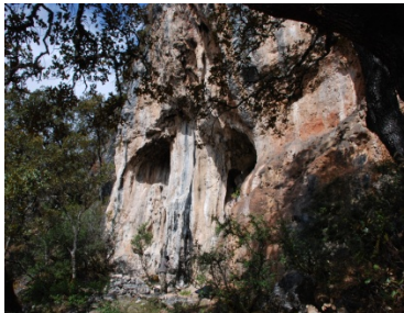
རྒྱལ་ཐང་རྫོང་རྒྱ་དཀར་ནག་ས་ཁུལ་གྱི་ཨ་མེས་གཤེན་རབ་སྐབ་ཕྱག